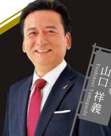
佐賀県知事 山口 祥義 Yoshinori Yamaguchi